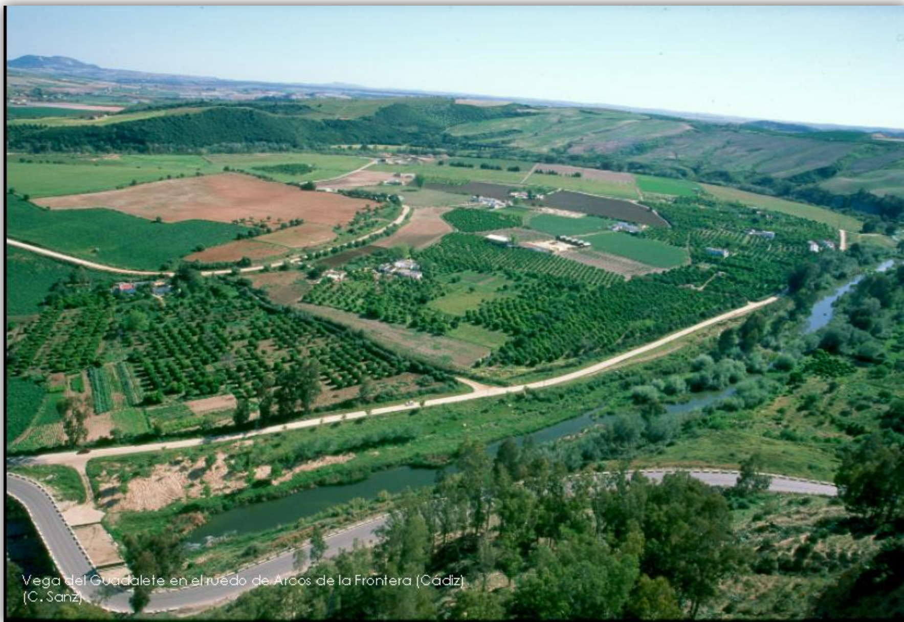
Vega del Guadalete en el ruedo de Arcos de la Frontera (Cádiz) (C. Sanz)